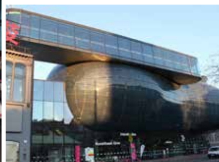
T-Breakfast im Kunsthaus Graz am 19. Februar 2019